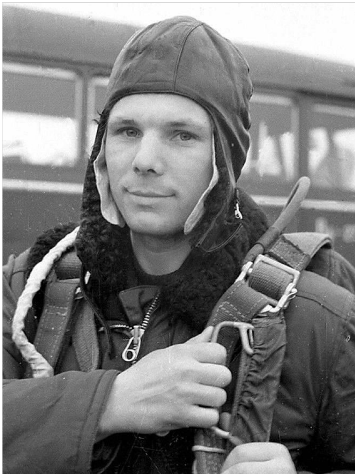
Юрий Алексеевич Гагарин (1934 – 1968)